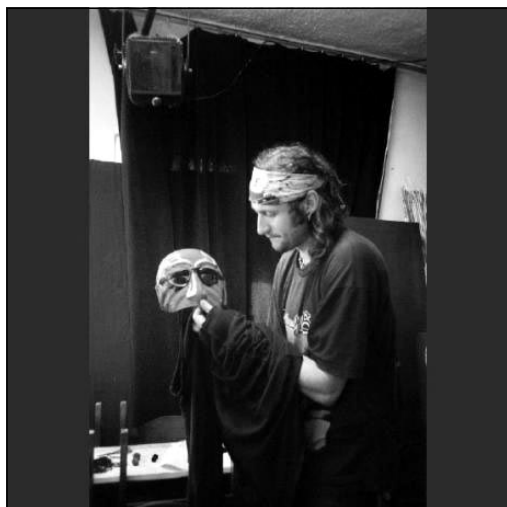
Куклени техники, използвани във Форум-театър

Могат да се изброят още много проекти или идеи за проекти на театрално-социалната формация театър „Цвете“. Така и ще завърши този текст – с идеи, реализирани частично благодарение на добрата воля и личната социална ангажираност на екипа ѝ, срещаци най-вече пасивността на държавата. Като идея за изграждане на арт-програма по гражданско образование. Или като стремежите на формацията да създаде младежки театрално-дискусионни клубове по места, младежка мрежа от хора с гражданска доброжелателност и активност, които да се ангажират с арт-социална дейност сред свои връстници. Да намери и съмишленици сред педагозите, чрез което еднократните посещения и моментното позитивно въздействие от театралните ѝ представления, арт-