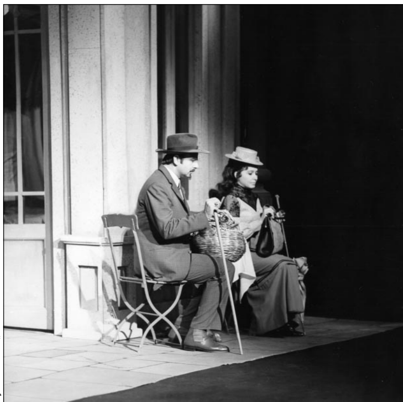
Музей на НТ „Ив. Вазов“

В. С.: По този начин те кара да изпълняваш неговата идея, но много фино, следи те