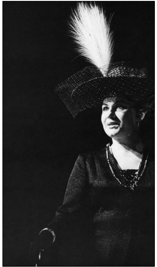
Музей на НТ „Ив. Вазов“