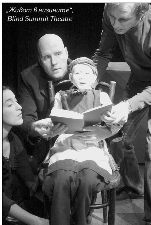
„Живот В низините“, Blind Summit Theatre

гат търговец на картини и неговия любовник (или любовница – полът остава размит и е без значение, тъй като ролите се играят и от двамата актьори), който е болен и има нужда от скъпо струваща операция за сърдечна трансплантация. „Англия“ неусетно се превръща в покъртителна драма, която откровено обсъжда относителността и крехкостта на стойностите в човешкия живот и изкуството. Още по-необичайно театрално преживяване предложи компания „Ротозаза“ със спектакъла „Етикет“, в който актьори няма, а участник е самата публика. „Етикет“ се играе в обикновен бар в работното време, докато хората пият кафето си. Публиката се разпределя по двойки на 3 маси и получава по един чифт слушалки. Върху масите са разхвърляни