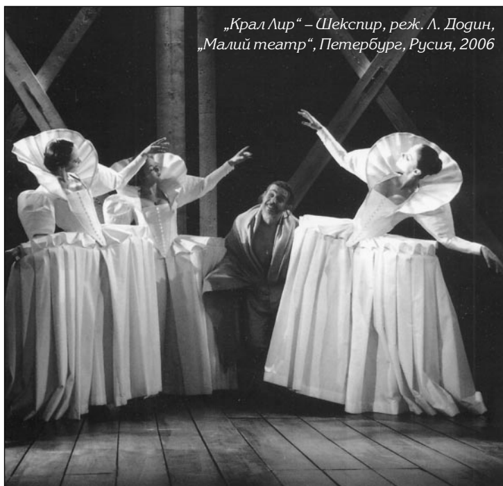
„Крал Лир“ – Шекспир, реж. Л. Догин, „Малий театър“, Петербург, Русия, 2006

„Крал Лир“ на Лев Догин в „Малий театър“ е една от превъзрасяните от руската критика постановки през последните години. Спектакълът наистина е добър, достоен за най-реномираните театрални фестивали по света. Политическата трагедия на Шекспир в режисьорската интерпретация е превърната в интимна, семейна грама. Акцентът е паднал върху характеристиките, борещи се за собственото си аз в един хаотичен свят. Въпреки силните визуални решения и