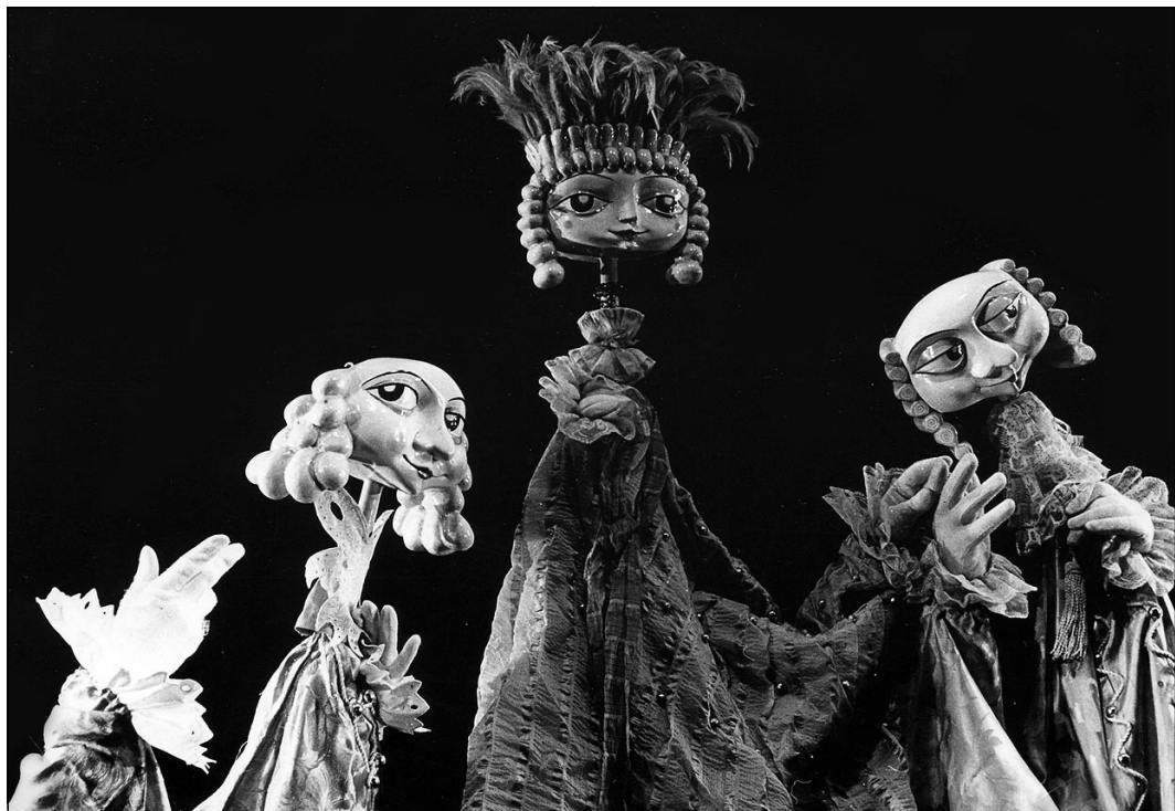
„Любовта на Алцест или Мизантроп“ по Молиер. Постановка Л. Гройс. Сценография арх. Ив. Цонев, 1968

то на Кирякос Аргиропулос учреди „Панаир на куклите“ – фестивал, който през 2004 г. стана международен.