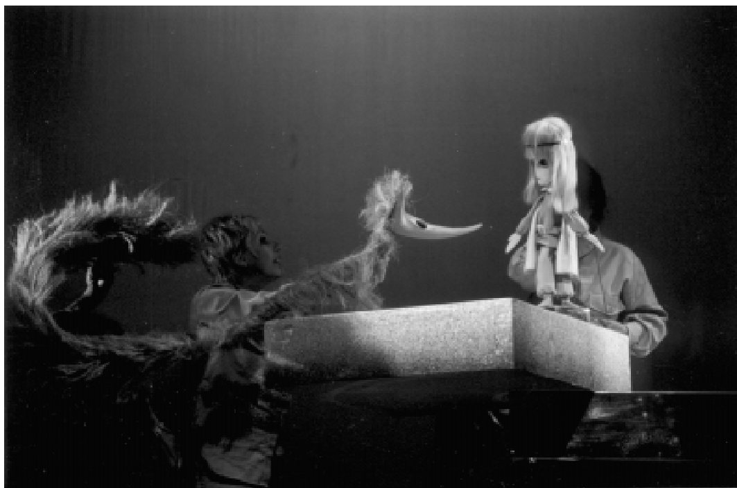
Сцена от „Малкият принц“ по Екзюпери

Спектаклите за деца „Веселите петлета“, „Буратино“, „Спящата красавица“, „Максимка“, „Чими“, „Бубу“, „Румето и старият лъв“, „Наказаният пакостник“, „Златка златното момиче“, „Звездичко“, „Пепеляшка“, „Най-щастливият човек“, „Джуджето Дългоноско“, „Лудо-