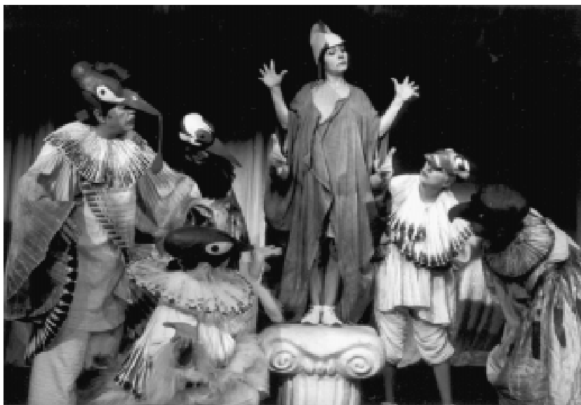
Сцена от „Птиците“ по Аристофан

съчинява приказка, а предлага тема. От началната рамкова картина на чайката, която лети под слънцето се развиват редица тематични цялости, които показват отношението към слънцето. Една кокошчица ще го клъвне и ще видим в нейната вътрешност то да се превръща в яйце, вътре в което се развиват пиленца. Някакво чудно неидентифицирано същество трескаво иска да го отмъкне. Чайката, която като лайтмотив, като червена нишка преминава през цялото представление накрая ще докопа слънцето, но само за това, за да си поиграе с него. Накрая слънцето се превръща в луна, най-напред като новолуние, след това като пълен месец, който бива коронясан от ято звезди. Може би и не случайно те са гванайсет и в началото се формират като символът на Европа. Но само малко по-късно звездите се различават и се формират в прекрасни съзвездия. Съвършената хармония на музиката и формите накрая се превръща