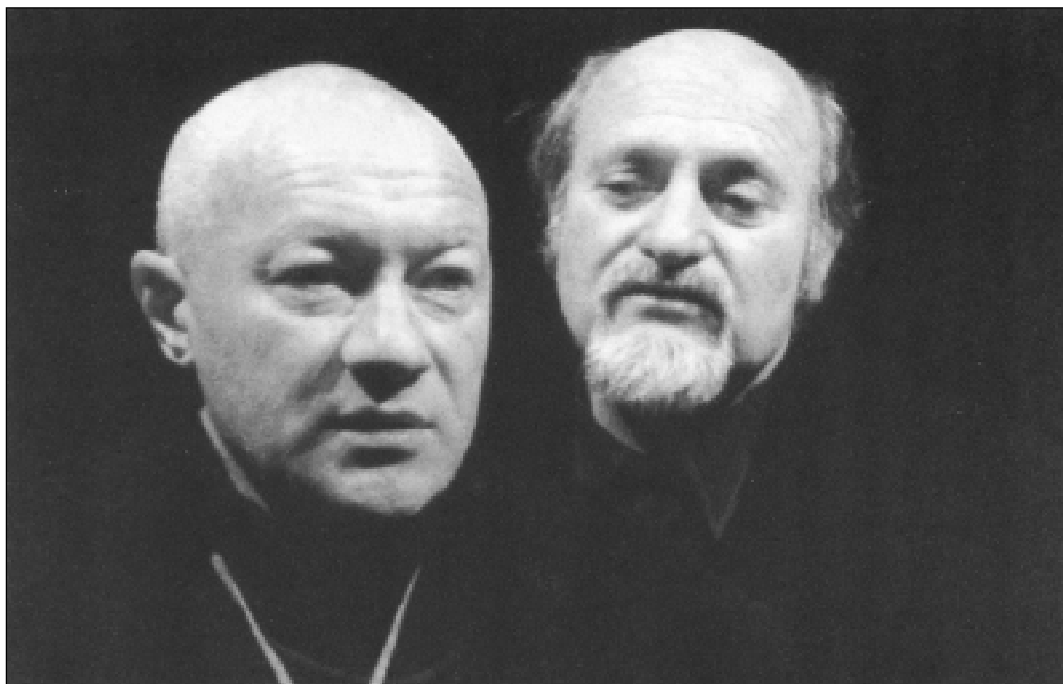
„Предопределените“ – Е. Канети, реж. Е. Панайотова, ДТ-Русе, 2002/03

Трилогията от драматургичните творби на Елиас Канети „Сватба“, „Комедия на суетата“ и „Предопределените“ остава голямо и забележително художествено явление не само в историята на Русенския театър, но и в културния живот на страната. Те разкриха философските прозрения на Канети, който много точно определя своите пиеси в знаменитото си изказване: „Смятам, че преди години моите пиеси далеч бяха изпреварили Вкуса на Времето. Днес, когато абсурдният театър е надминал себе си,